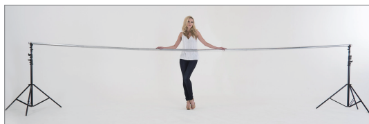
可以扩展至 6m 以适应更加广泛的需求