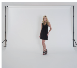
4m 支架由长约 1m 的分段组成