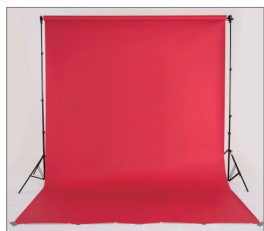
3m 支架配有伸缩横杆

独立背景支架配置有可旋转横杆，从而使升降背景变得更加轻松与安全。新设计的旋转连接器每次调整长度的范围更大，整个结构更加稳定和便于管理。3m 版本配置一个伸缩横杆。4m 版本由 4 支 1m 横杆组成，可以扩展到 6m 以适应更宽大的背景纸。