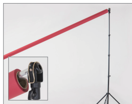
独有的旋转支架设计